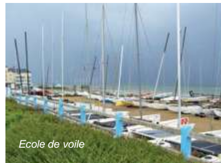
Ecole de voile

Station balnéaire familiale depuis 1921, Langrune-sur-mer est aujourd'hui propice aux loisirs de la plage, aux activités nautique et à la pratique de la pêche à pied sur les nombreux bans de rochers. Langrune-sur-mer offre tous les commerces de proximité (médecin, boulangerie, artisans...) avec en outre, le privilège de profiter du dynamisme et des infrastructures de Caen.