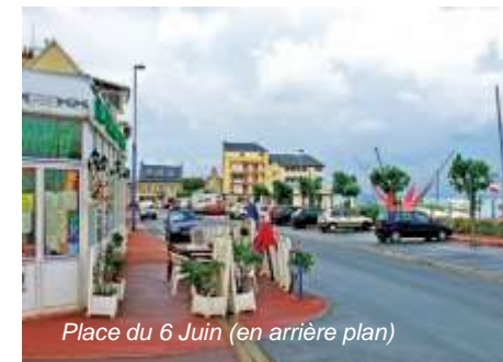
Place du 6 Juin (en arrière plan)