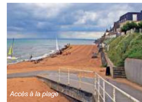
Accès à la plage