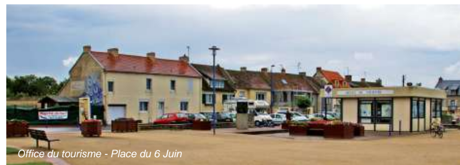
Office du tourisme - Place du 6 Juin