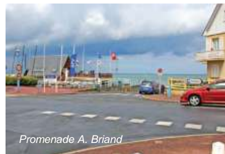
Promenade A. Briand